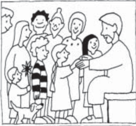
FINDE DIE UNTERSCHIEDE IN DEN BILDERN

Herr Gott, himmlischer Vater, du hast durch deinen Sohn Jesus Christus den Tod besiegt. Du hast Jesus aufgeweckt. Wir danken dir dafür. Du willst allen Menschen ewiges Leben schenken. Darüber sind wir froh. Amen.