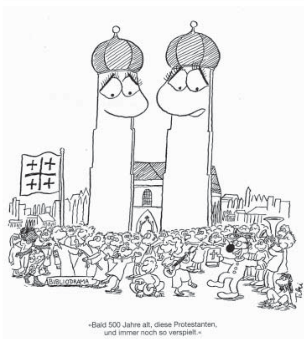
TIPP: Bildwitz kann auch ausgemalt werden!

Vor dem Einschlafen denkst Du vielleicht noch über manches nach. Du kannst Dich noch einmal an den Tag erinnern. Was war heute am schönste, worüber habe ich mich gefreut? Was war heute nicht so schön, worüber habe ich mich geärgert? Wovon will ich Gott erzählen? Habe ich heute etwas getan, was nicht gut war? Gibt es etwas, wofür ich Gott um Verzeihung bitten möchte? Wofür und für wen will ich beten? Wofür habe ich ihm zu danken?