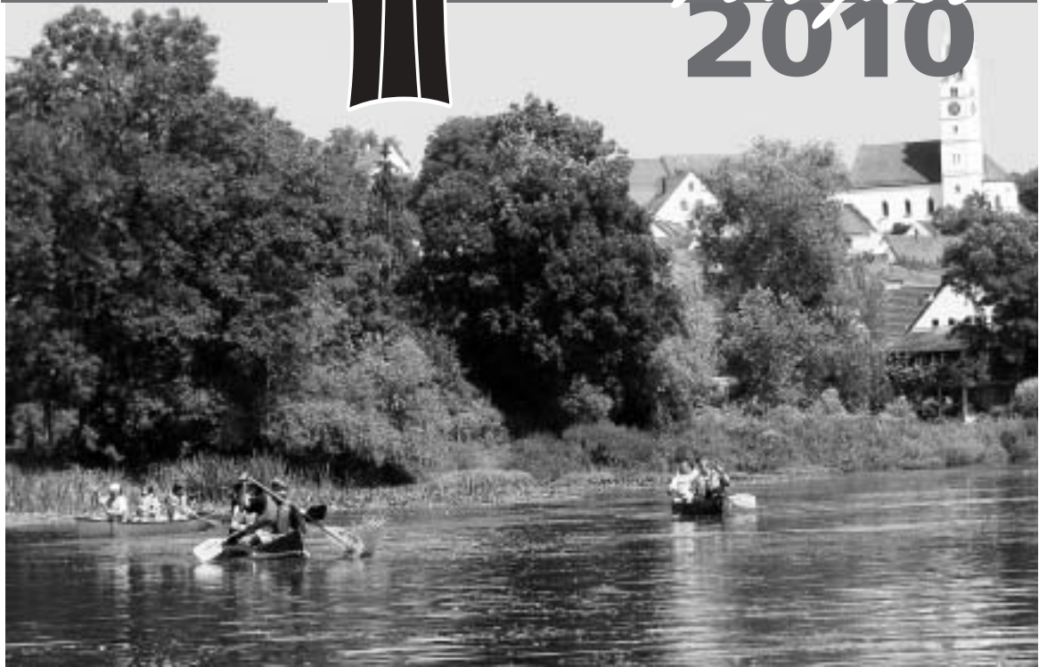
Bild: Konfirmanden Kanufahrt auf der Wörnitz